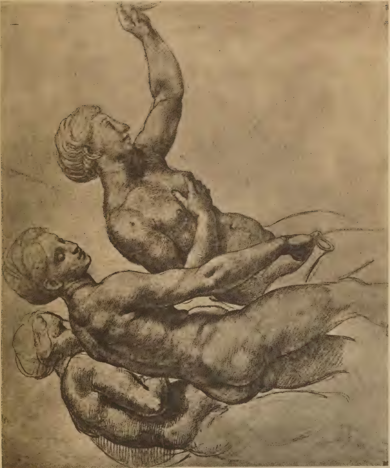
Esquisse pour les Trois Grâces de la Farnesine